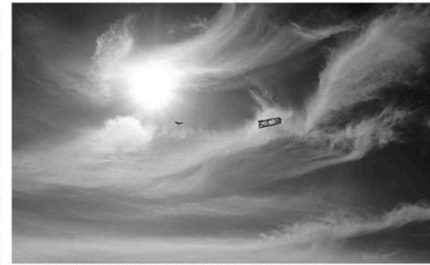
Artistak apirilaren hegaldatu zuen Gernikako zeruaren irudia Berlingo zeruan. MICHAEL KLANT

Plazer estetiko hutsak eraman zuten lehen zera trukea egitera, 1999an, eta denbora behar izan